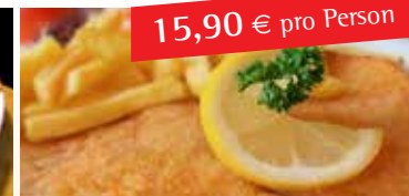
Herbermann's großes Schnitzelbuffet zum Sattessen

Genießen Sie tolle Spezialitäten vom Schwein und Huhn mit klassischen Beilagen und saisonalen Salaten in angenehmer Atmosphäre.